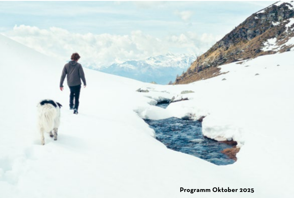
Programm Oktober 2025