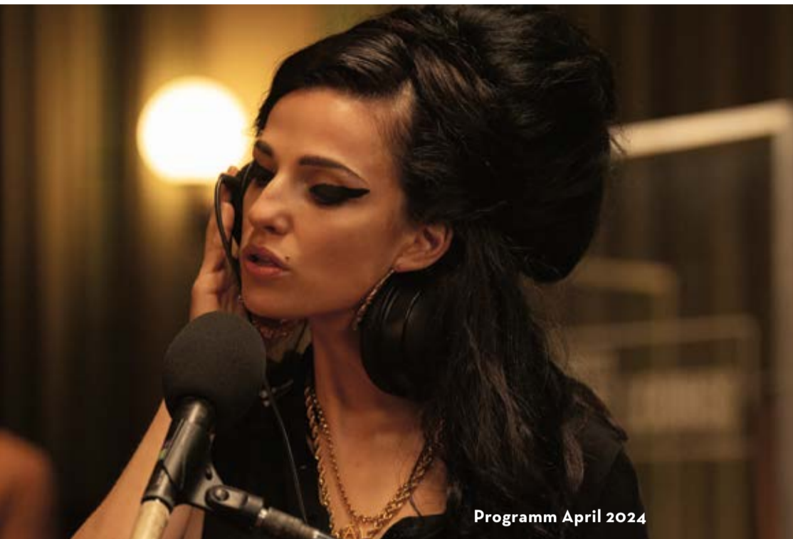
Programm April 2024